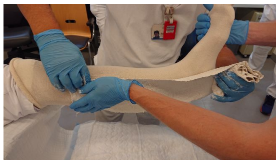
Anmodulation der nassen Longuette