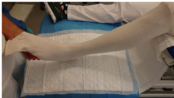
Anlage des Frotteestrumpfes