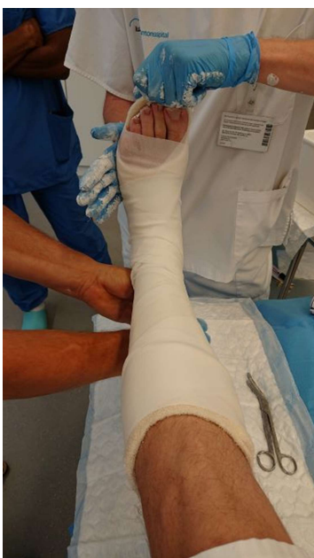
Einwickeln mit nasser Binde